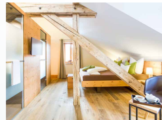
The Alpina Mountain